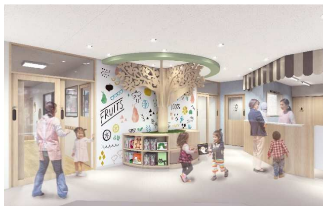
※園内 イメージパース